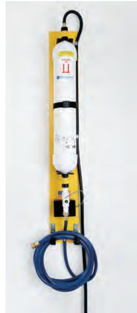
HydroPure Deionizer (PS-300)

Chariot de remplissage à batterie HydroFill™ Pièce numéro: CRT-12V