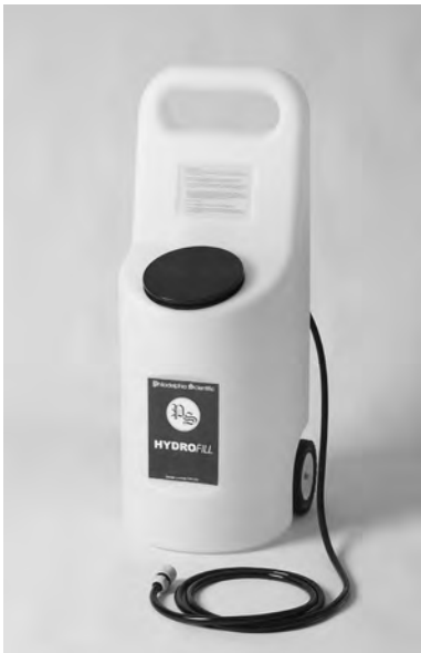
HydroFill™ Battery Operated Watering Cart (CRT-12V)

Approvisionnement en Eau Autorisé par la Compagnie.